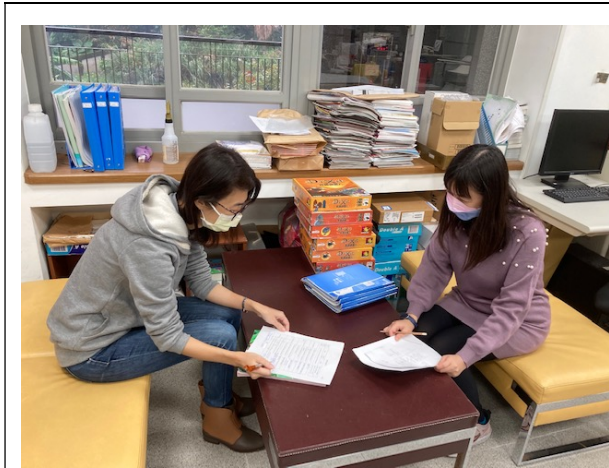
觀課教師分享所觀察到之現象