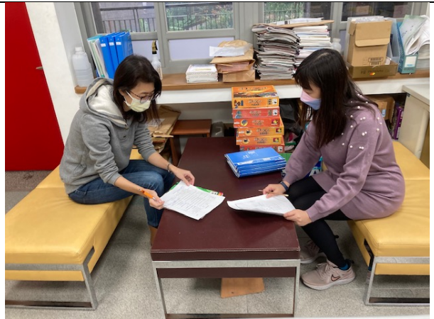
教師互相提問討論