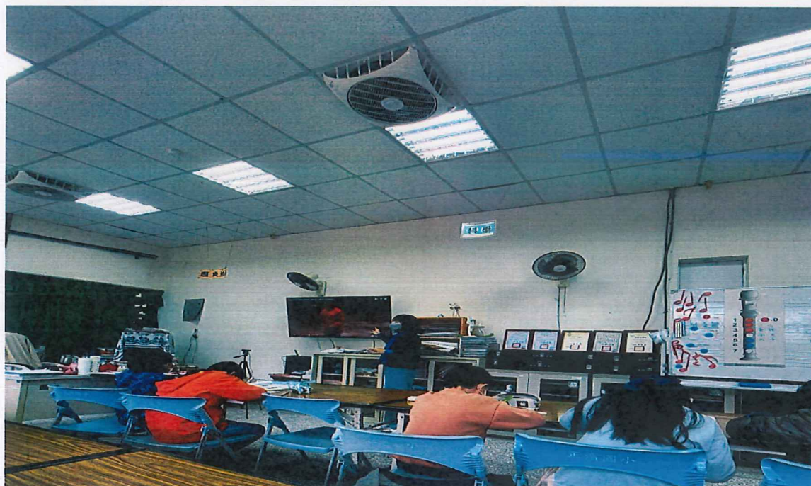
照片說明：介紹二胡的構造與音色。