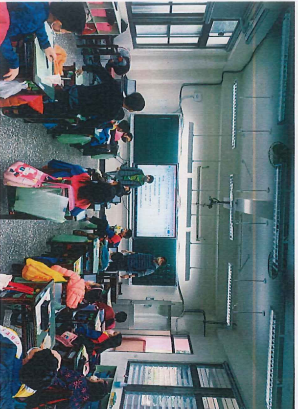
照片說明：同學向上台分享報告的學生進行提問