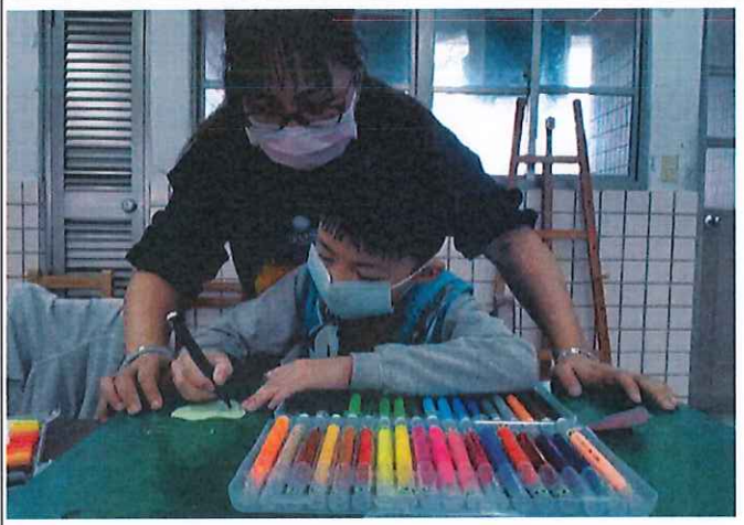
老師協助特殊生製作桌遊