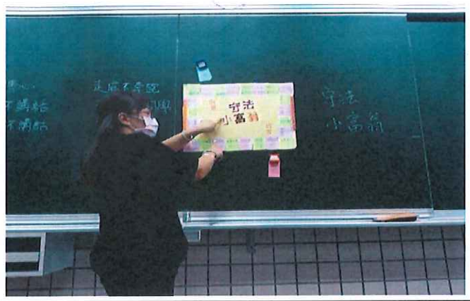
老師講解桌遊製作方式