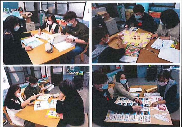
老師進行備課及議課