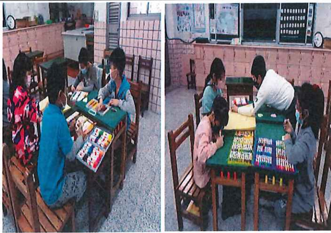
小組開始製作桌遊