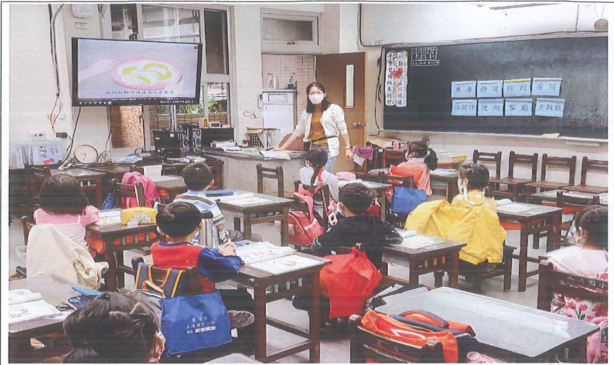
照片說明：教師運用電子書中的影片進行教學，並請學生回答問題。