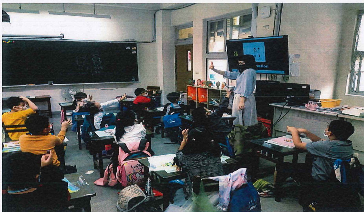
照片說明：教師帶領學生使用手勢1-5說明音量之大小