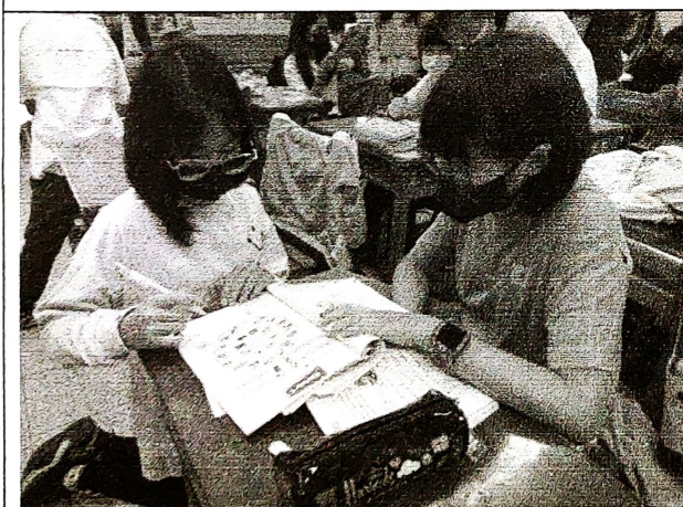
Spin and Say 口說練習