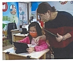
(課程中能隨時指導學生)