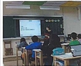
(資訊媒體融入教學)