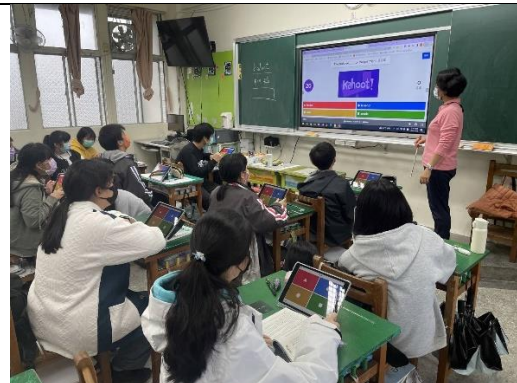
教師根據學生的錯誤進行講解