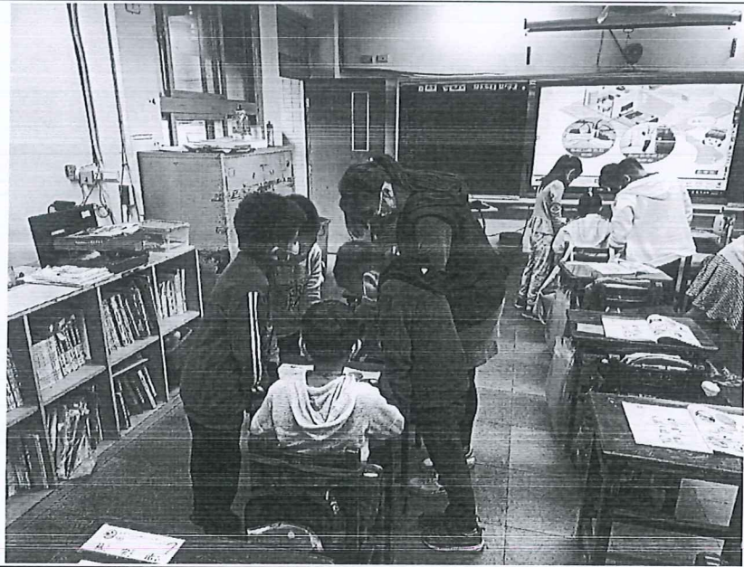
照片說明： 小組討論家中潛藏危機，教師巡視與指導。