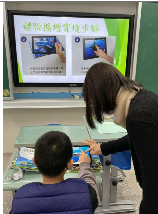
學生自行使用平板搭配書籍體驗擴增實境 閱讀