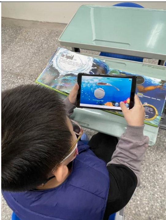
學生自行使用平板搭配書籍體驗擴增實境 閱讀