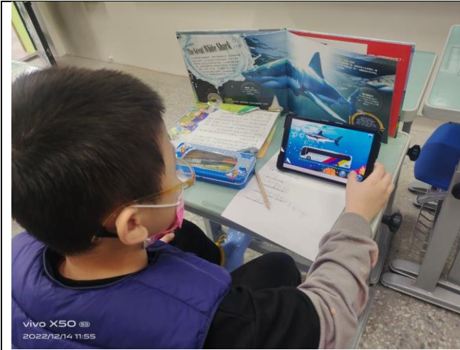
學生閱讀後自行完成學習單