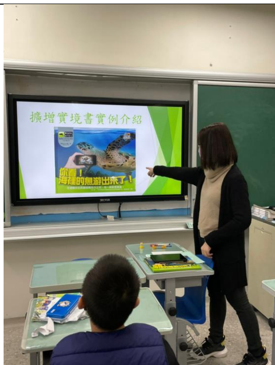
介紹擴增實境書籍