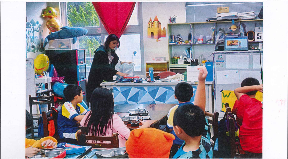
照片說明：教學者指定學生編號前來領取製作餅乾之材料