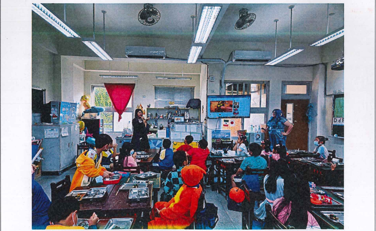
照片說明：教學者說明自黏袋使用方法並提醒學生注意事項