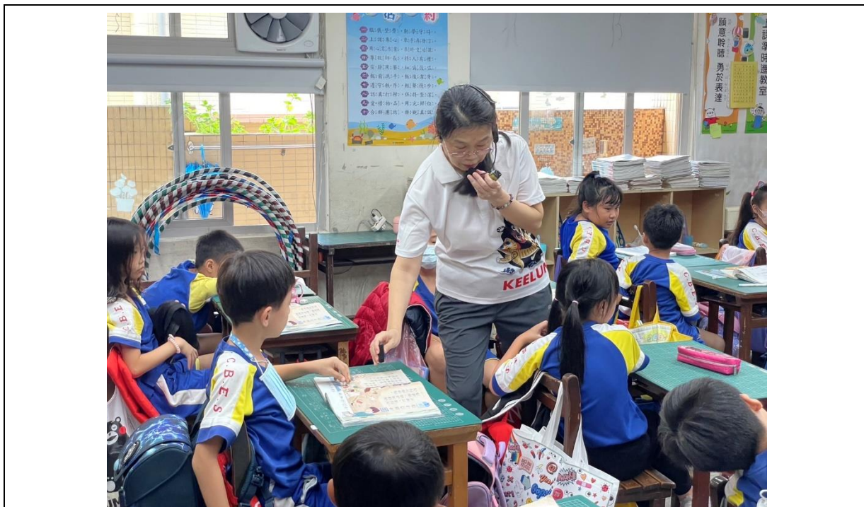
照片說明：學生回答正確，教師即時蓋章回饋。