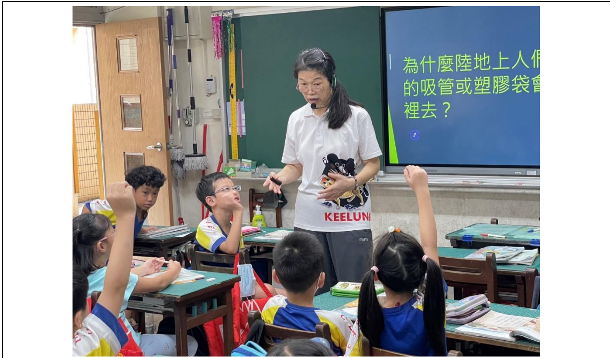
照片說明：教師提問，學生舉手回答。