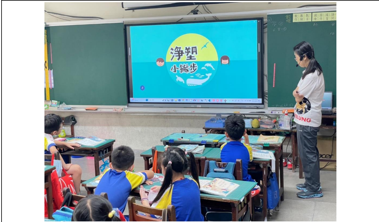
照片說明：播放淨塑小撇步影片