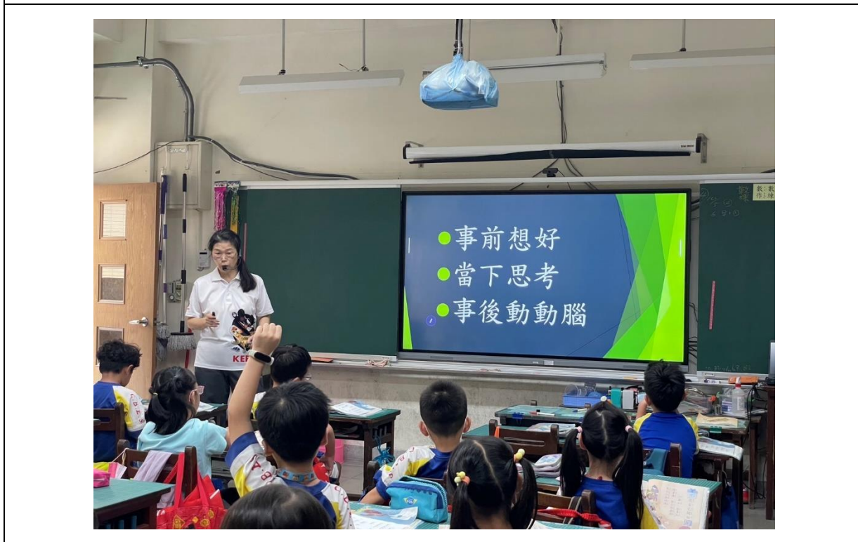
照片說明：減少使用塑膠的行動態度