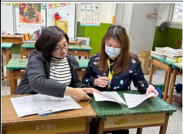
說明：Giving lesson feedback