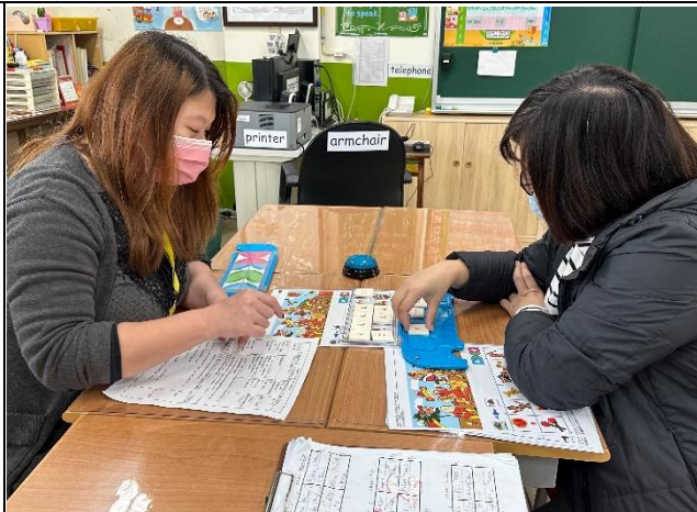
說明：Explaining the "Tiles Matching Game"