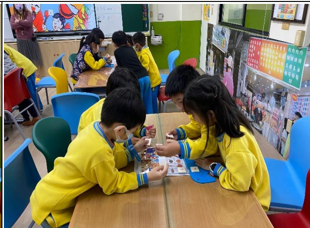
說明：Playing the "Tiles Matching Game"