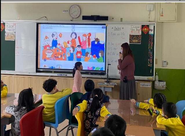
說明：Vocabulary Review Time