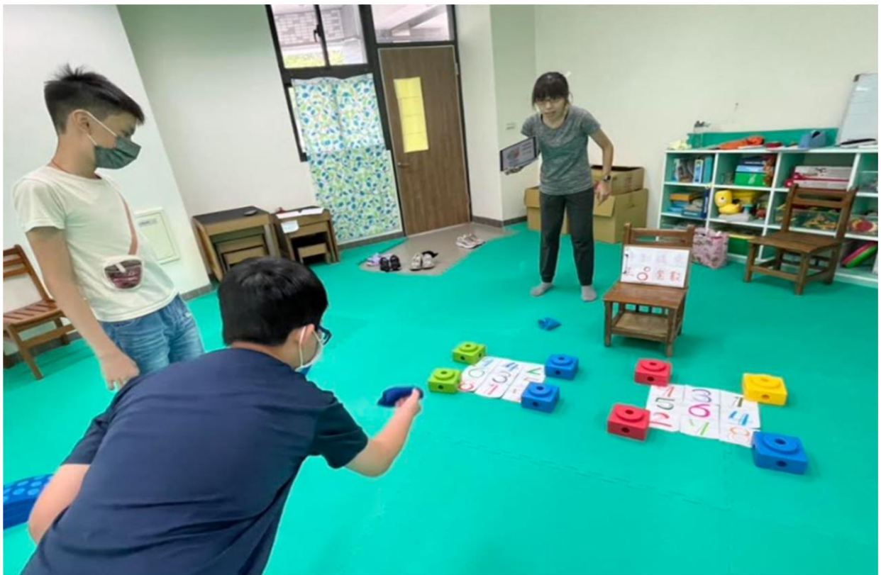
內容概述：發展活動-第二關-手到擒來 -擲準與乘法練習