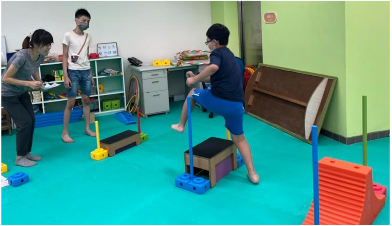
內容概述：發展活動-第一關-身騎白馬-登階與跨欄練習