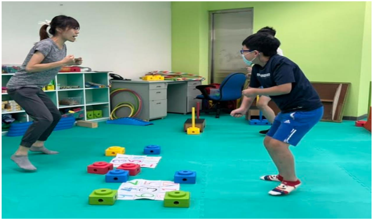
內容概述：準備活動-暖身操-TABATA-原地快速小跑步熱身