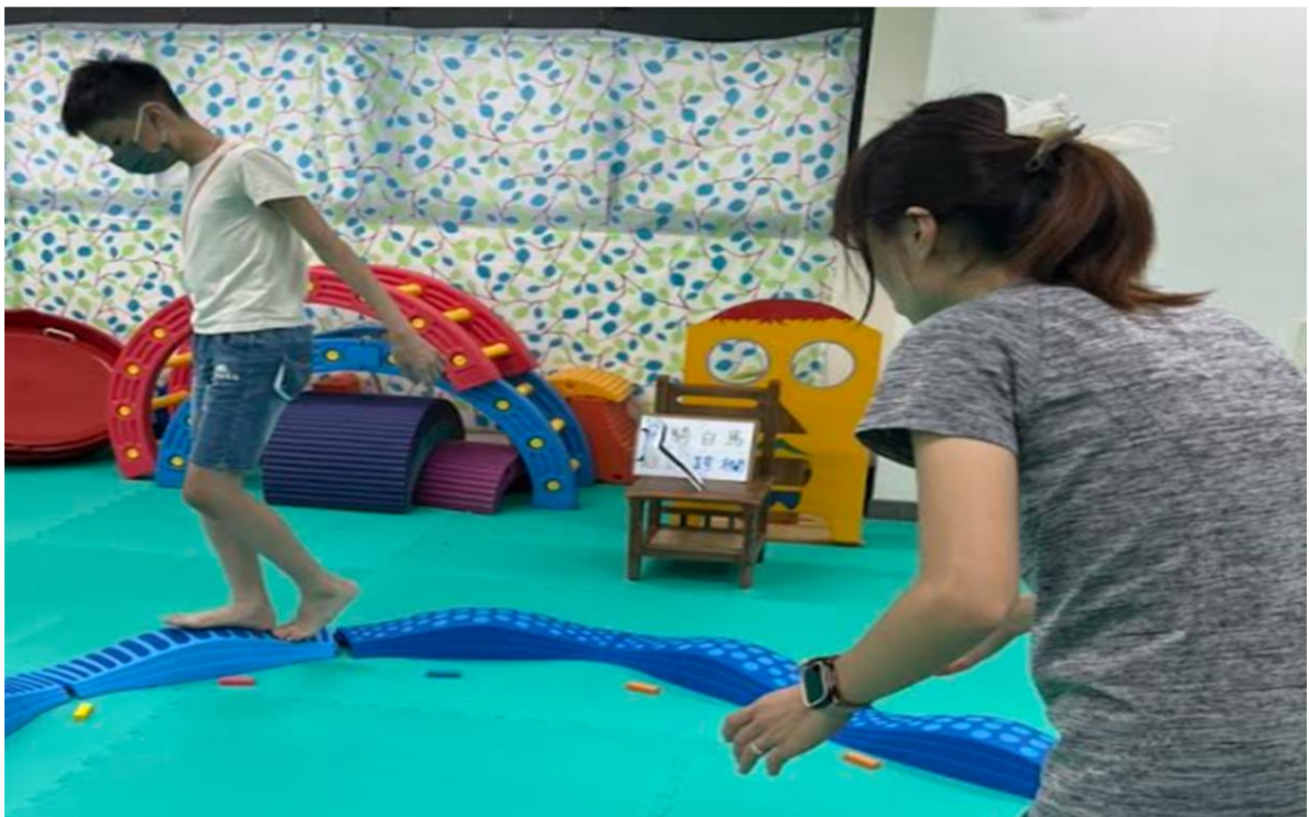
內容概述：發展活動-第三關-飛渡運河-左右兩腳交替行走