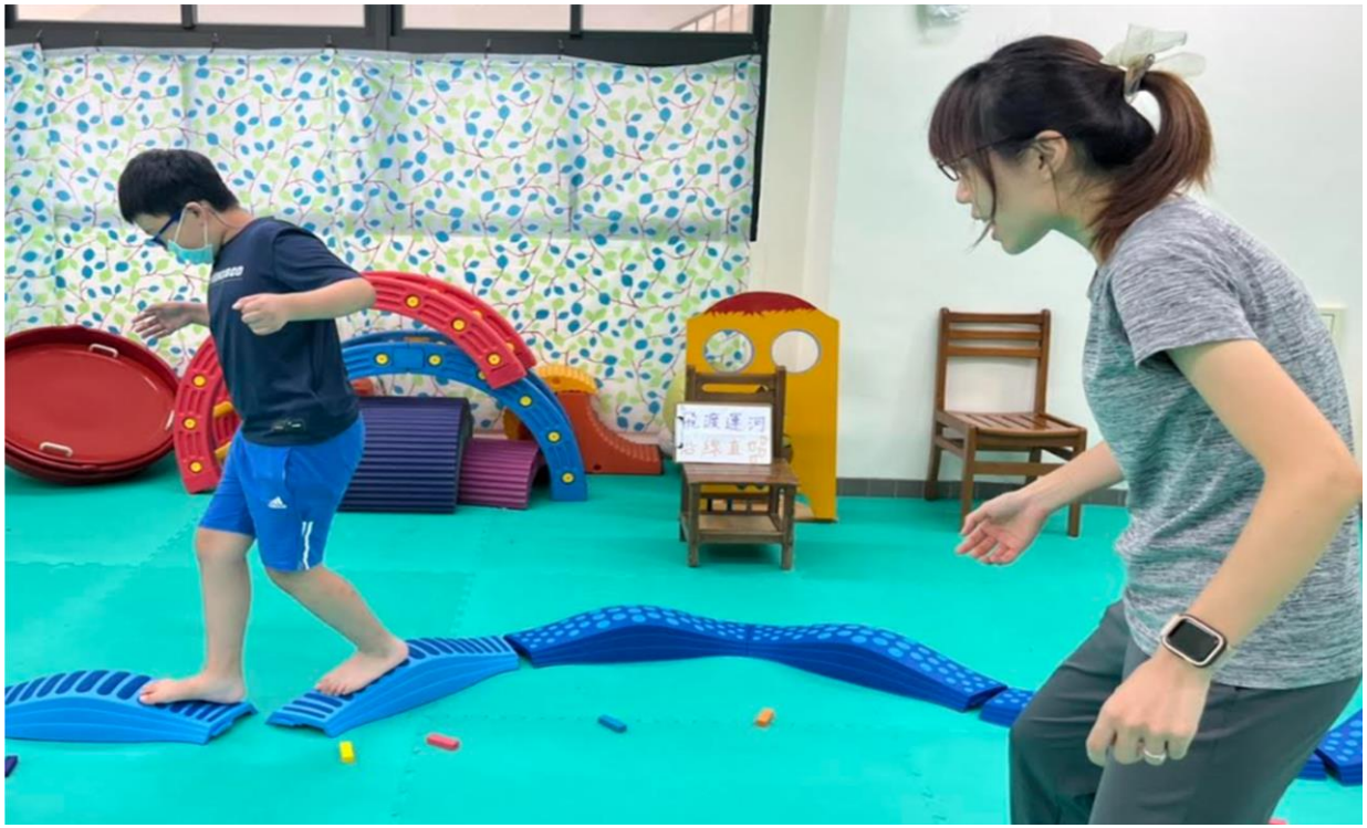
內容概述：發展活動-第三關-飛渡運河-左右兩腳交替行走