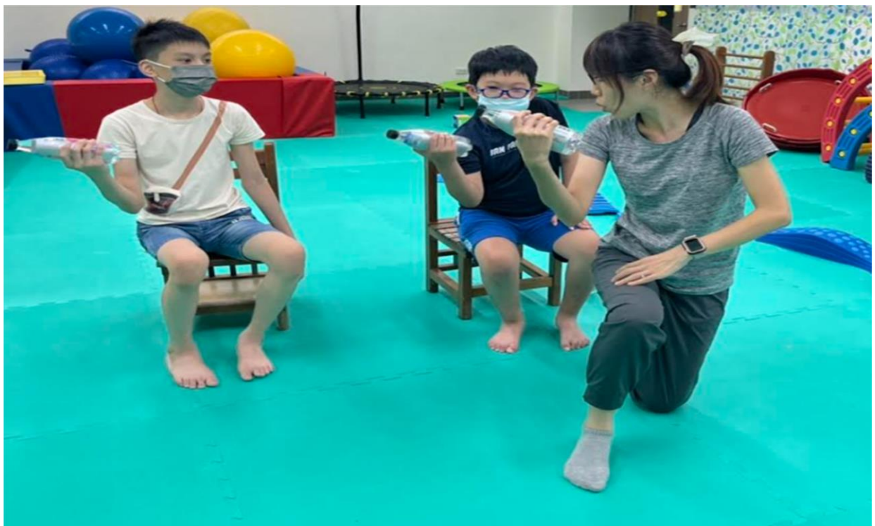
內容概述：準備活動-寶特瓶舉重-上肢肌耐力訓練活動