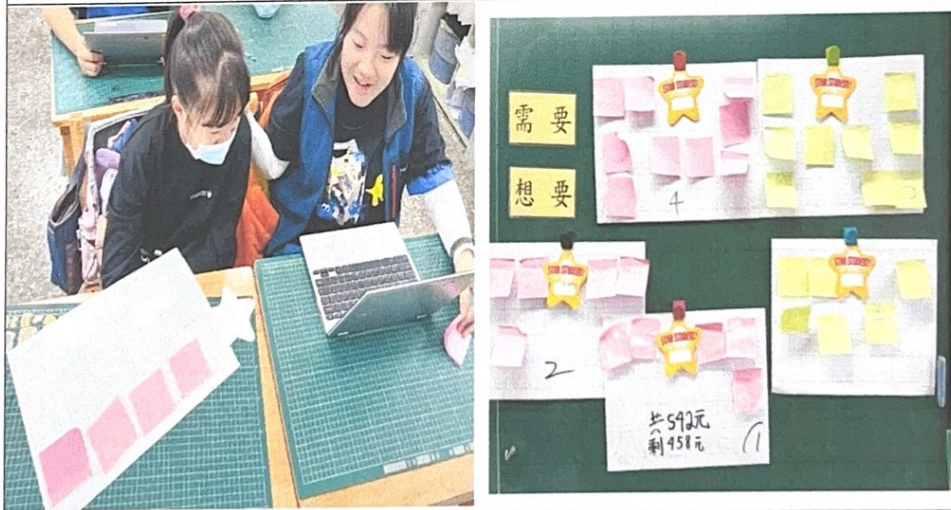
照片說明：11/29 學生實作及分享