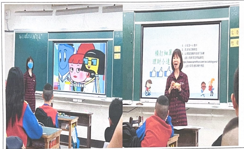
照片說明：11/29公開授課:理財小達人