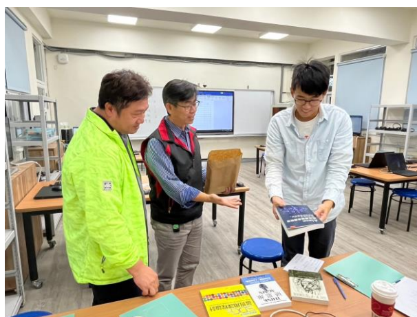
獲贈 AI 運算思維教學書籍，增進教學能力