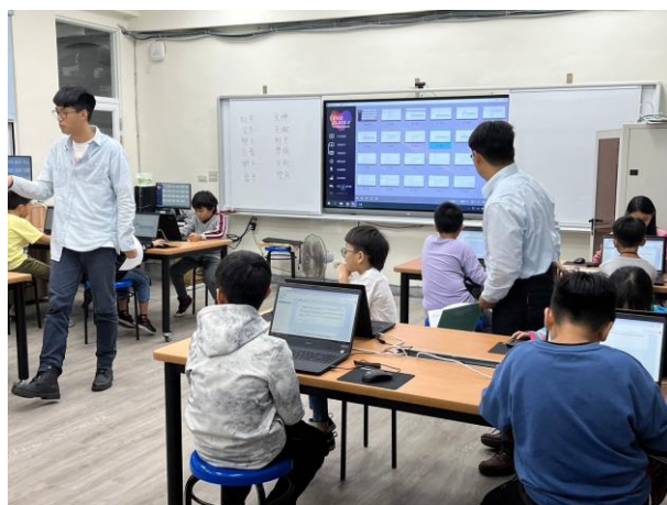
協助學生完成指令，確認自己星座