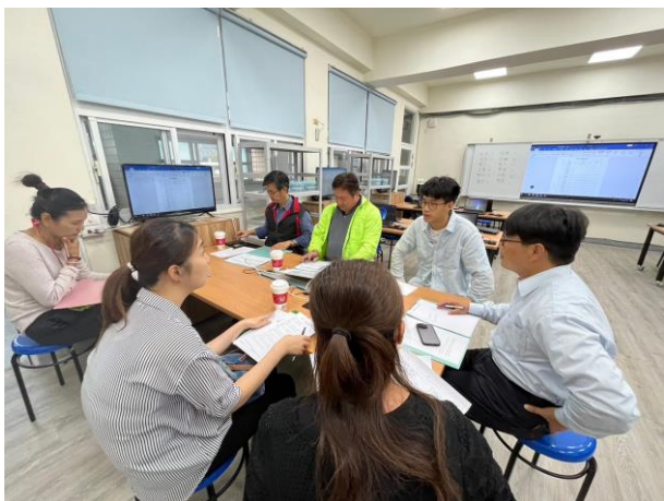
說明課程目標與安排課程活動