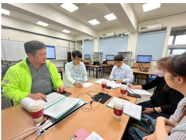
校長、老師們給予寶貴回饋意見