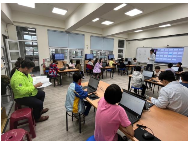
課堂教學進行，嘗試透過 AI 得到合適回答