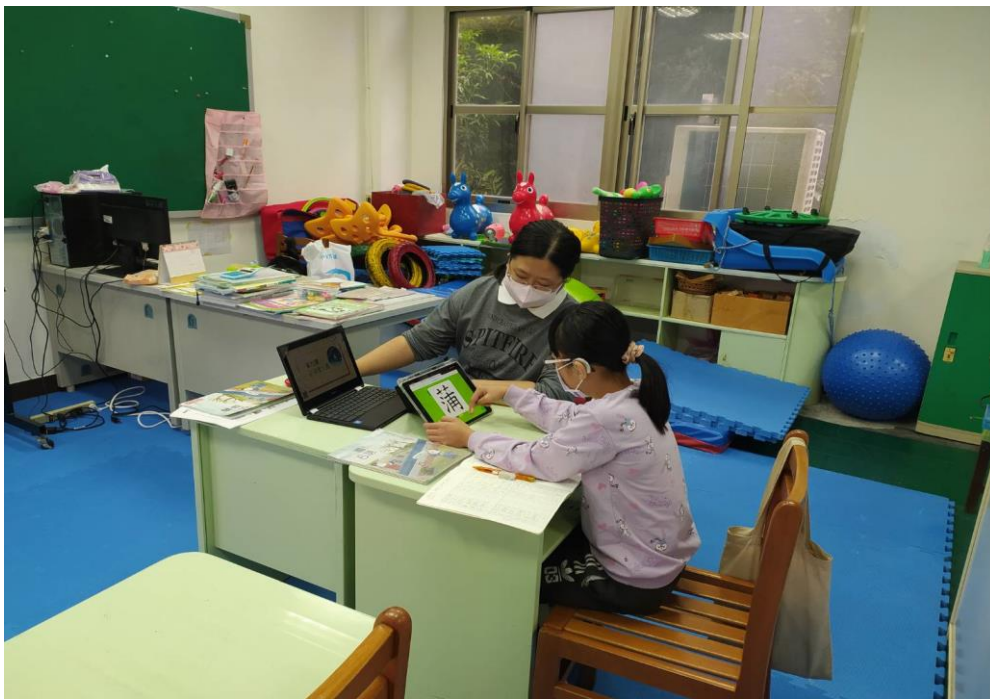
照片說明： 學生正在利用 iPad 自行練習寫出正確的筆順