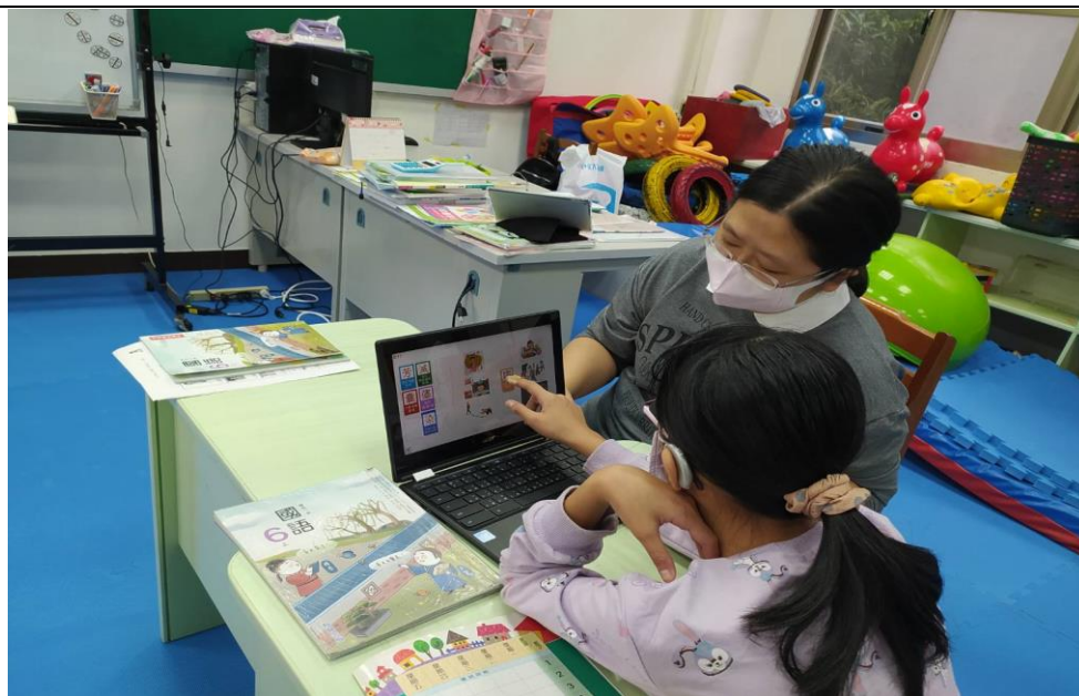
照片說明： 學生利用網站練習生字語詞配對