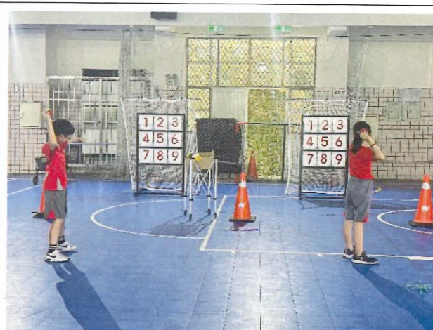
說明：擲準實際操作練習