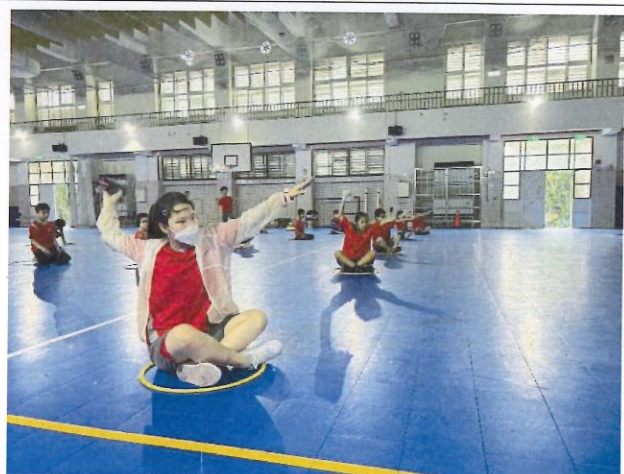
說明：利用抹布做鞭打訓練