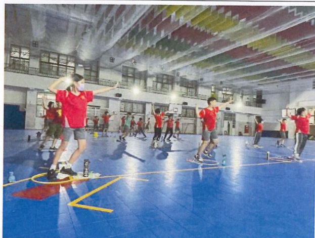
說明：站姿原地投擲訓練