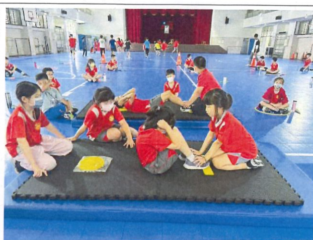
說明：熱身體操結束