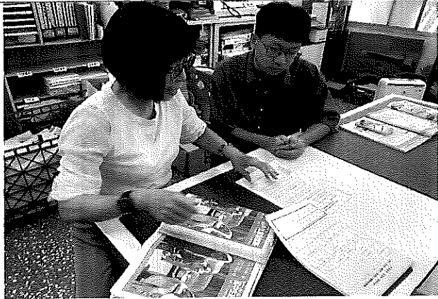
說明：進行授課前的備課