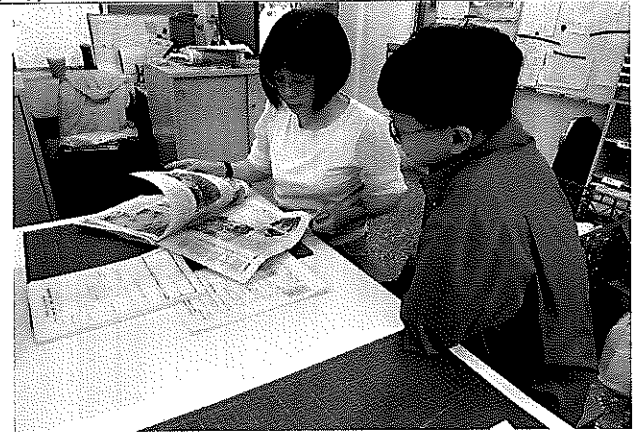
說明：進行授課前的備課