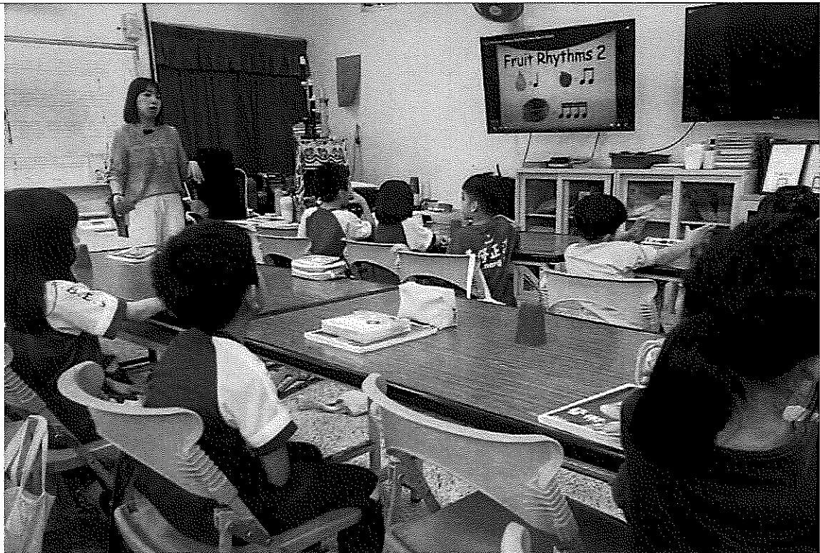
照片說明：教師說明節奏型態，學生聆聽。