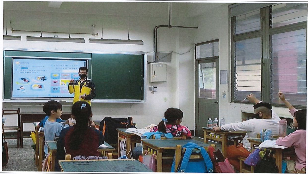
照片說明： 學生分享吃冰經驗，以此引起教學動機