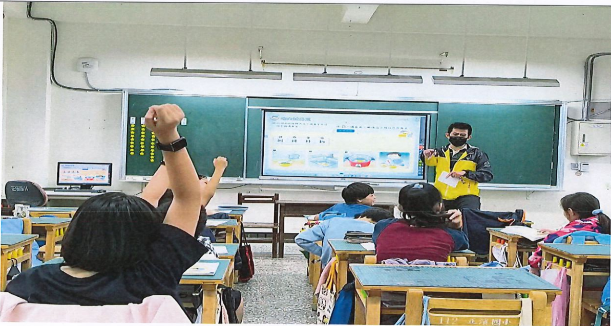
照片說明： 教師指導煮綠豆湯流程，學生以台語說出。