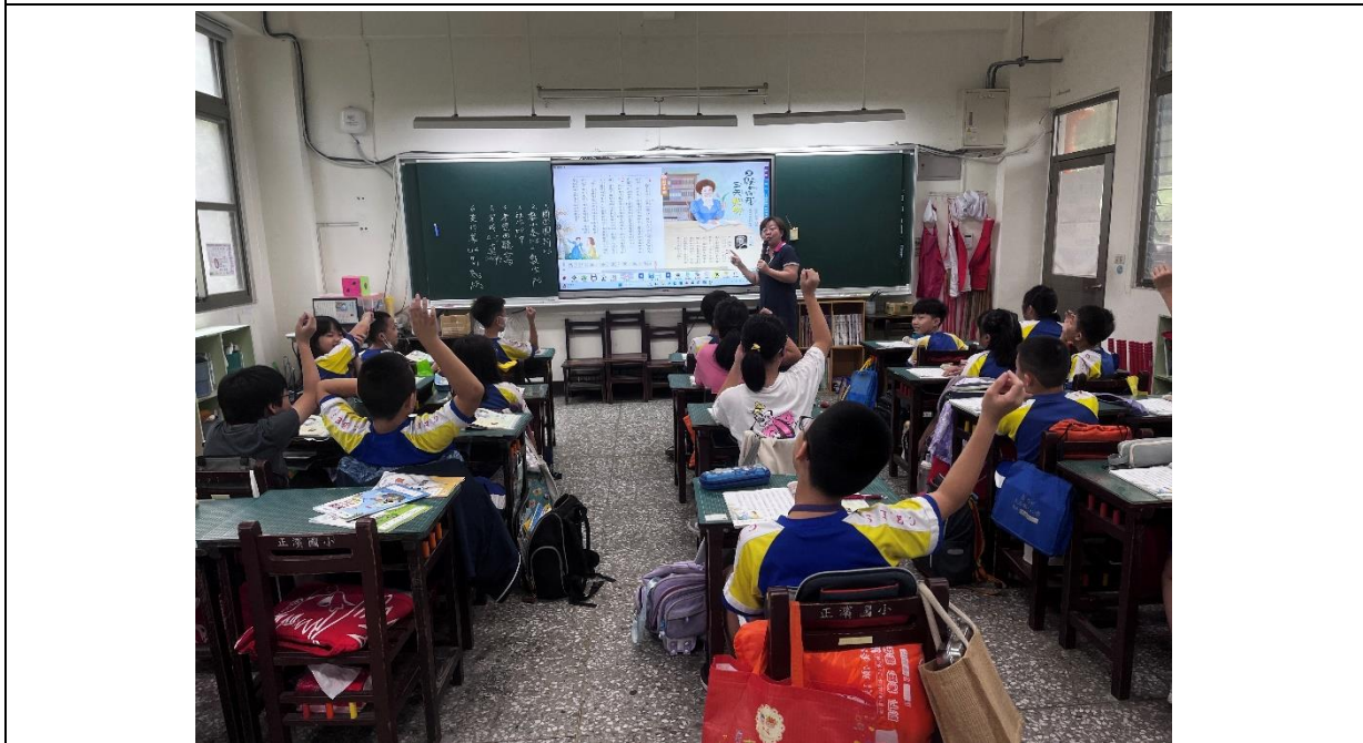
活動：教師請學生發表課文大意 日期：1131004