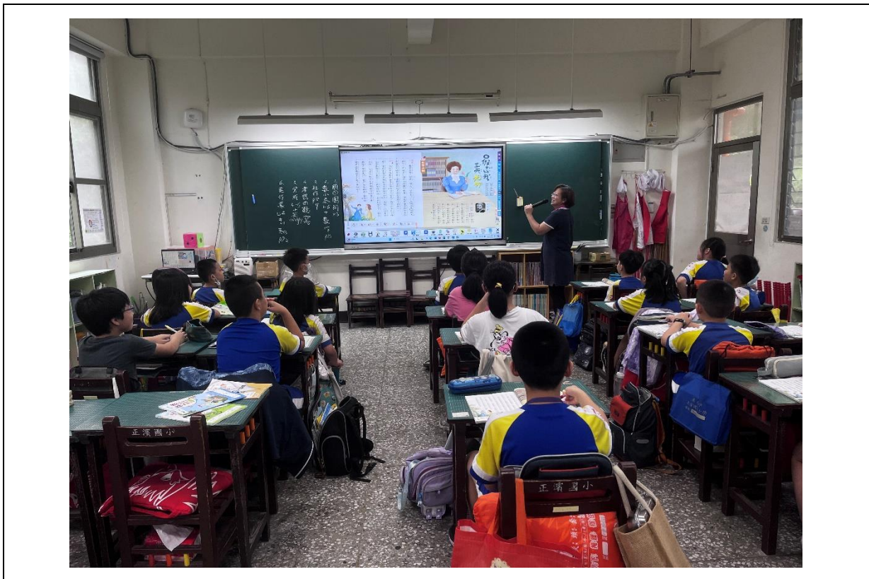
活動：教師講解課文內容日期：1131004