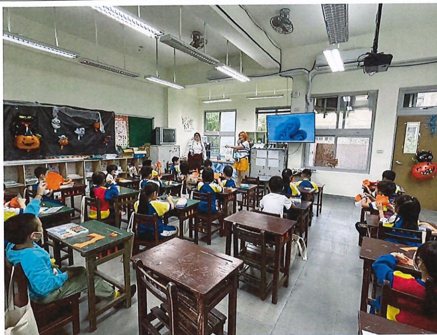
照片說明： 教師說明如何製作南瓜棒棒糖