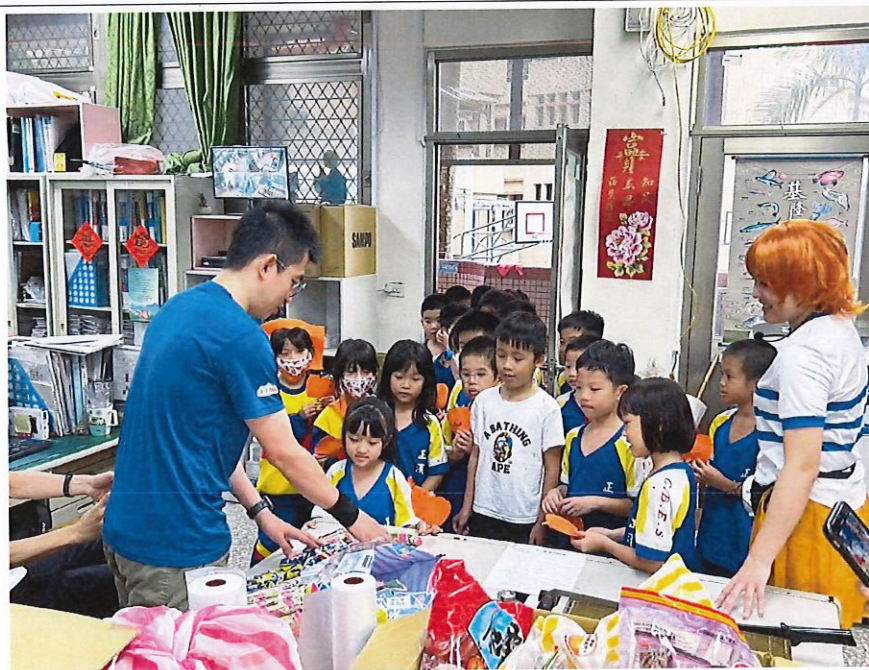
照片說明： 教師帶領學生至辦公室 Trick or Treat!