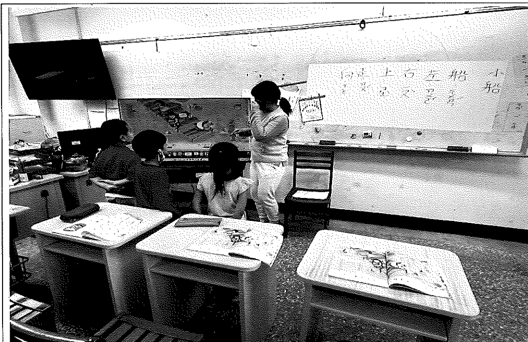
照片說明：教師使用科技輔具帶孩子認讀課文