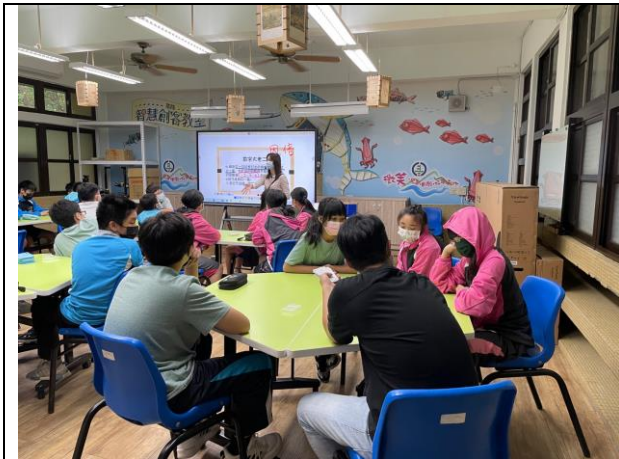
說明 維鴻老師入班觀課