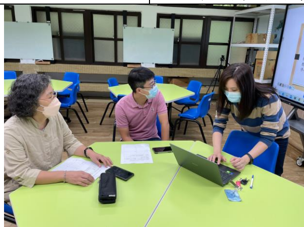
說明 將 my view board 說明檔投影在大屏上