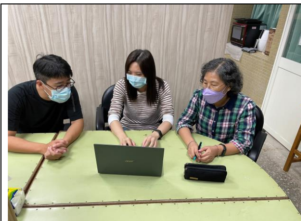
說明 修正 my view board 檔案