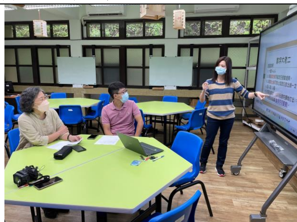
說明 使用 my view board 說明第一個活動