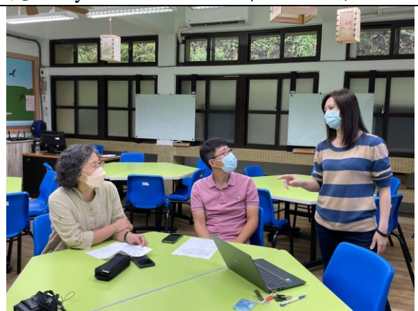
說明 討論活動流程、內容是否有需要修正的地方