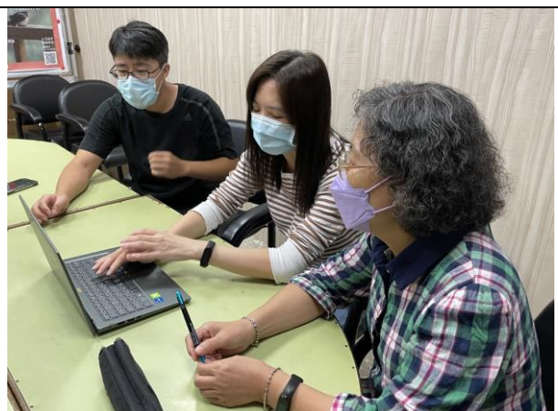
說明 討論活動流程、內容是否有需要修正的地方