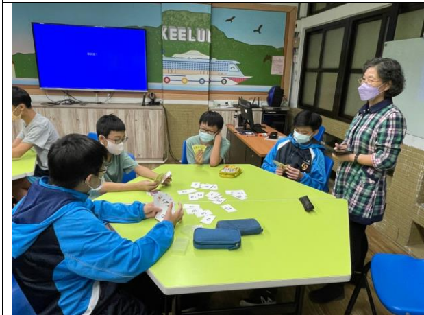
說明 寶卿老師入班觀課