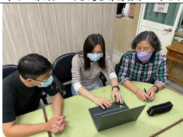
說明 一起確認 my view board 檔案調整結果