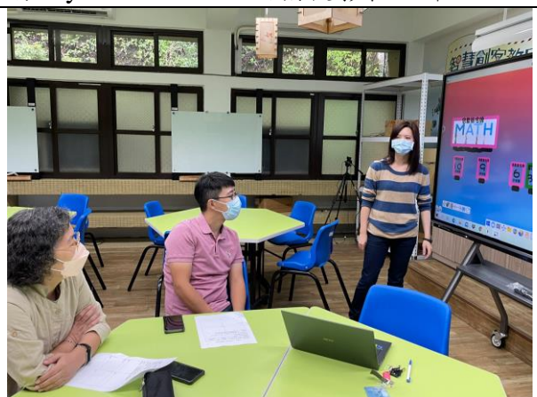
說明 使用 my view board 說明第二個活動