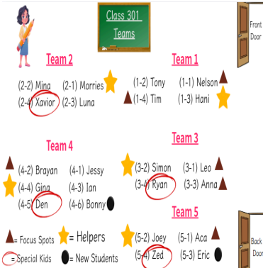
相片說明: (Date: 115-03-11) (1) 備課討論 (2) 學生座位表 (含4名特教生座位)