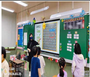
相片說明: (Date: 115-03-25) 上課花絮