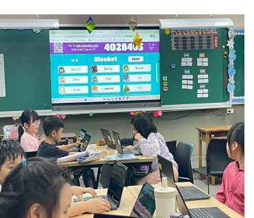
相片說明: (Date: 115-03-25) 議課討論