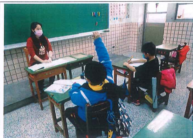
照片說明：同學們輪流分享自己曾打籃球的經驗。