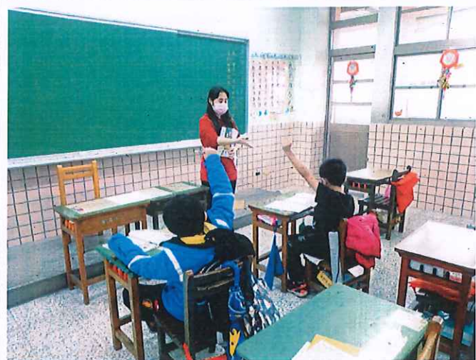
照片說明：以問答方式，歸納出課文大意，及課文提問。