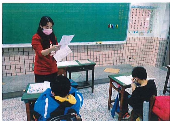
照片說明：分享發表自己的課後活動。