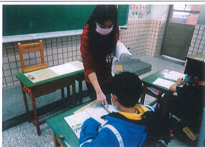
照片說明：觀察課文中的情境圖(分享觀察到的部分,如:人事時地物。)