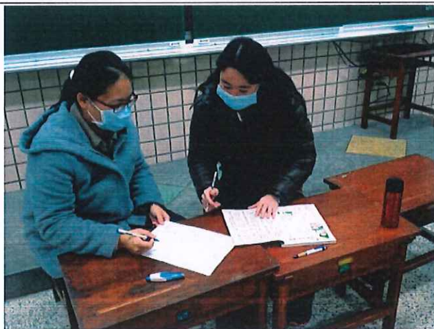
照片說明：與宙儀老師共同備課、議課，提供給我一些教學建議。