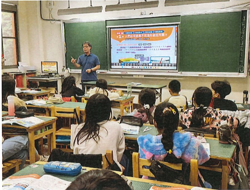
照片說明：搭配動畫來介紹 臺灣 的誕生