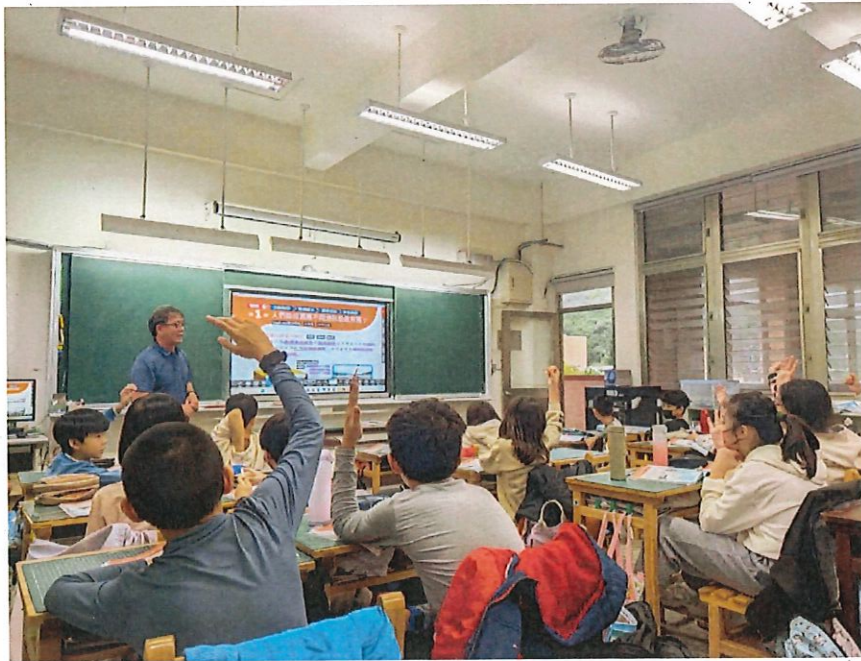
照片說明：重點整理及討論活動