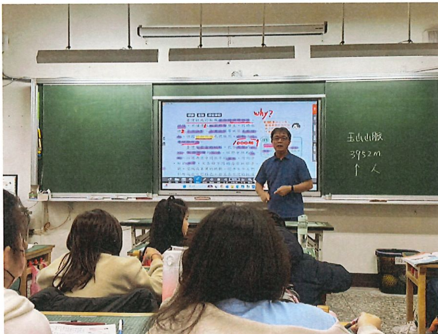
照片說明：板塊的擠壓造成了 陸地 和 山脈