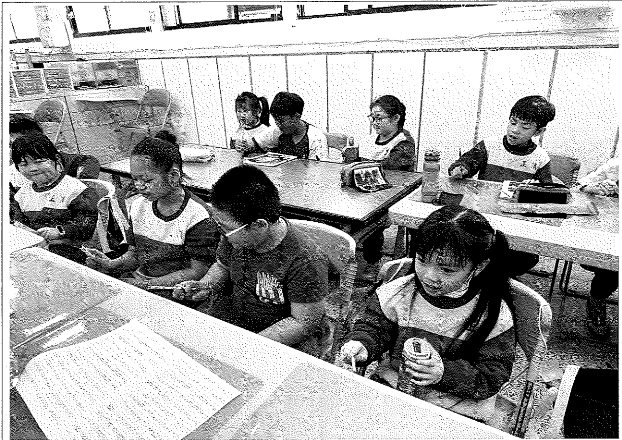
照片說明：學生聆聽樂曲的速度、力度變化，用筆敲桌子的方式表達。